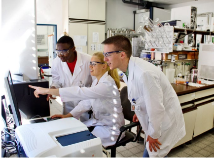
Für angehende Mediziner unerlässlich: fundierte naturwissenschaftliche Kenntnisse